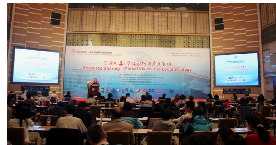
来自国内外的专家学者与世界各地的会议代表分享业界最新发展

本次会议采用主题报告与讨论相结合的方式，交流和吸收馆际互借与文献传递领域的前沿学术研究成果，为推动国内和世界各地的交流与合作起到积极的促进作用。本次大会的发言和会议资料，可访问 http://ilds2013.calis.edu.cn/ 获取。