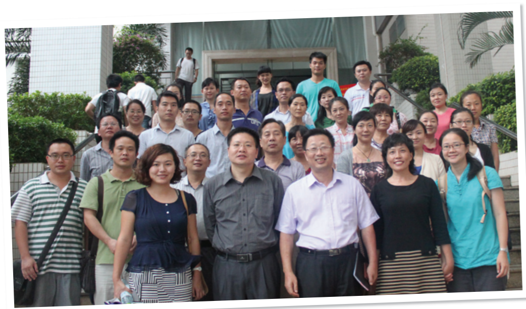
华南区域中心深入海南省宣传推广CASHL

为了使更多的海南高校师生、人文社会科学研究者和工作者深入认识和了解CASHL,共享CASHL的资源和服务,提高海南的整体文献资源保障水平,CASHL华南区域中心(中山大学图书馆)联合CALIS海南省文献信息中心于2013年10月14-15日开展了“您身边的CASHL——深入海南篇”主题宣传推广暨馆员交流座谈会。