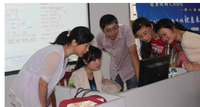
中山大学图书馆老师做CASHL系统培训