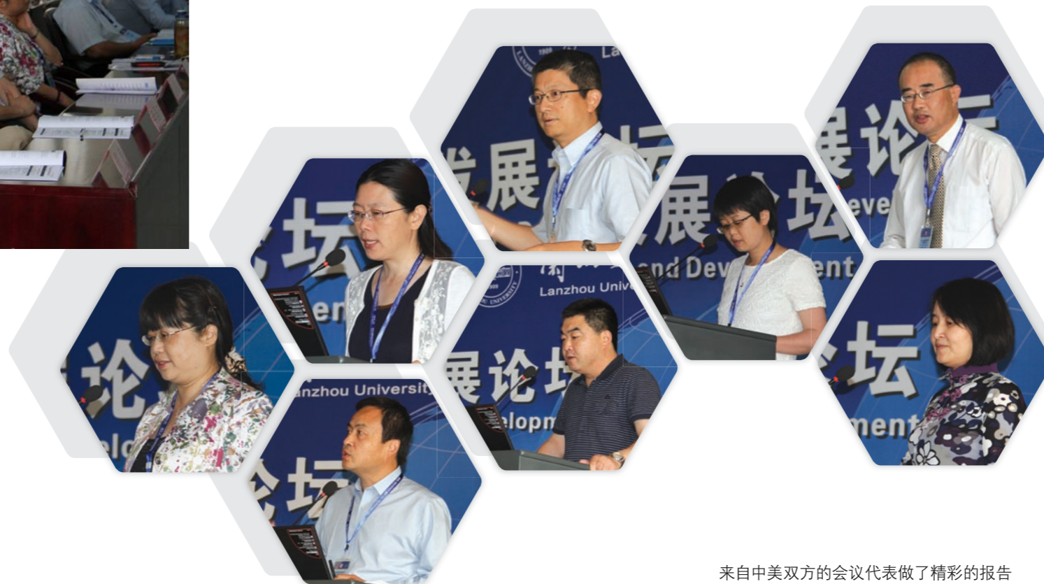
来自中美双方的会议代表做了精彩的报告