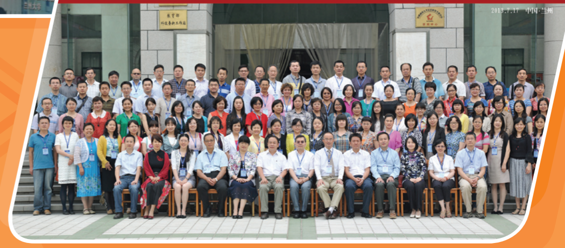
第二届中美高校图书馆合作发展论坛合影